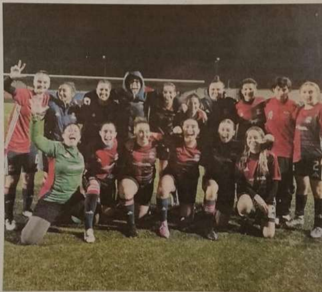
La formazione femminile del Sestri Levante