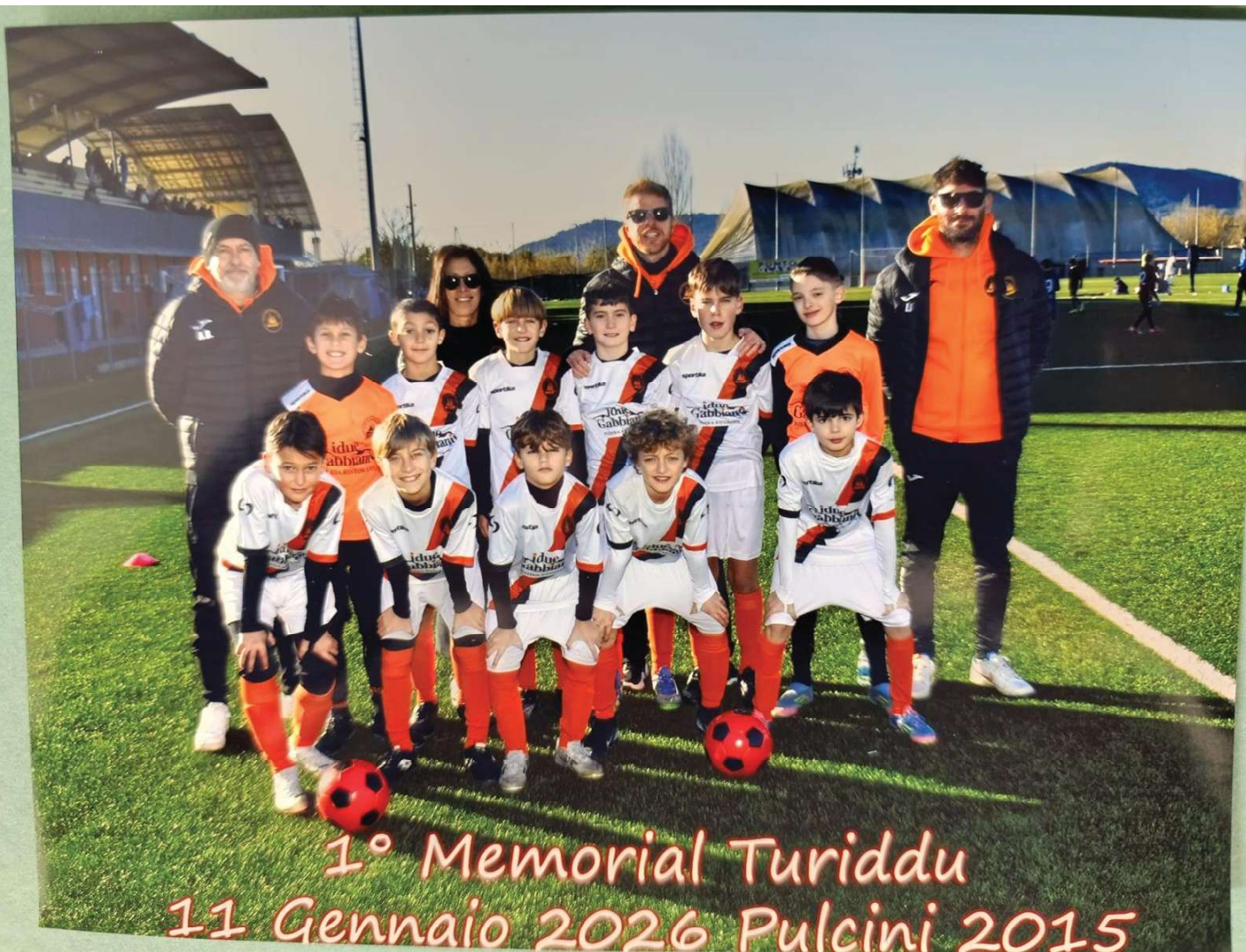
1° Memorial Turiddu 11 Gennaio 2026 Pulcini 2015

numero 02/2026 - III stagione - 12 gennaio 2026