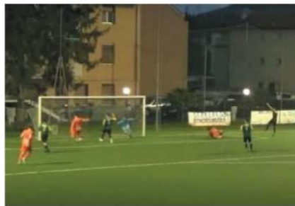
L'1-0 di Villa in Rivasamba-Athletic Albaro

In classifica, prosegue la risalita del Rivasamba che ora è al secondo posto con 27 punti, al pari del Pietra Ligure, davanti a Fezzanese con 26, Camponorone