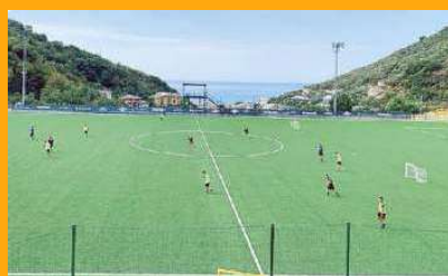
Il "Tre Campanili" di Bogliasco

La prima riguarda la carenza di spazi in Liguria che per sua conformità non può di certo paragonarsi alle regioni della Pianura Padana. La seconda è quella più semplicemente economica: nessuna società o quasi riesce a investire sulle strutture, sempre in concessione dal Comune, perché la spesa per intervenire è molto alta. Insomma, se si vuol portare avanti