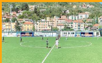
Campo sportivo "Ligorna"

una società di calcio con il settore giovanile non ci sono le finanze anche per riqualificare e gestire le strutture.