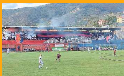
Il "Sivori" di Sestri Levante