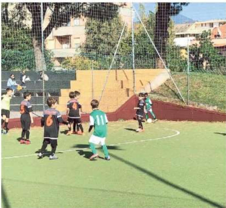
Una partita di calcio tra bambini: il valore educativo e di socializzazione dello sport spesso viene dimenticato

"Chi ti ci ha mandato, qui, scemo!" urla contro l'arbitro. E poi, chiamando il figlio, appendendolo alla griglia: "Non mollarlo, tienilo!" e va bene, ma, d'improvviso: "Segalo!". Beh, se me l'ha detto papà, magari si sarà detto il bambino... Ecco, l'avversario riceve il pallone, è veloce,