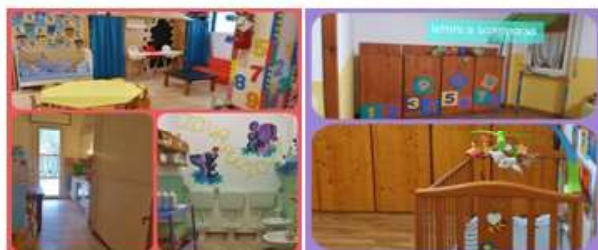
Abbiamo la cucina interna

QUESTE SONO LE STANZE CHE ACCOGLIERANNO I VOSTRI BIMBINI E LE VOSTRE BAMBINE