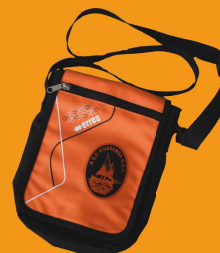
BORSELLO tracolla arancione