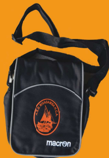
BORSELLO tracolla nero