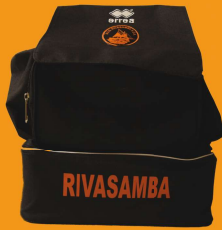
ZAINO con porta scarpe