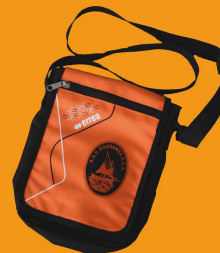
BORSELLO tracolla arancione