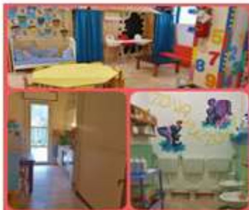
Abbiamo la cucina interna

QUESTE SONO LE STANZE CHE ACCOGLIERANNO I VOSTRI BIMBINI E LE VOSTRE BAMBINE